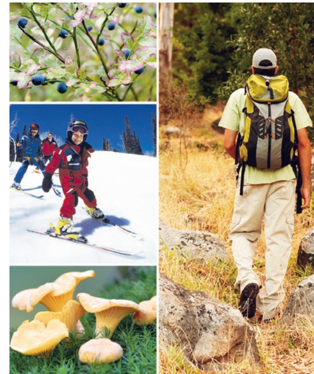
En procent av bruttointäkterna från vindkraften, uppskattningsvis 100 000 kronor per år, ska satsas på det rörliga friluftslivet i området.

De två vindkraftverken ska stå färdiga under 2011.