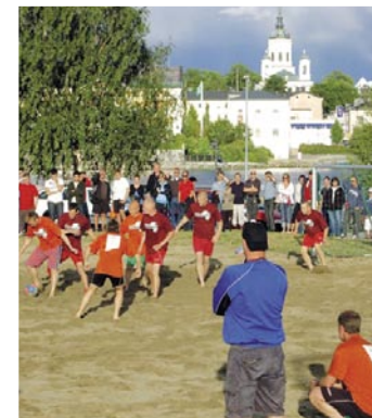
Beach Cup 2008

HEMAB sponsrar främst idrott, kultur och evenemang med tyngd-