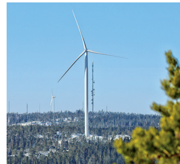
Vindkraftverken på Vårdkasen har gett ekonomisk vinst redan från start.

■ April blev den bästa månaden hittills, under 2013, för de två nya vindkraftverken på Vårdkasen. Elproduktionen blev 61 procent högre än beräknat. Sedan årsskiftet har de producerat 23 procent mer än förväntat utifrån den prognos som tagits fram.