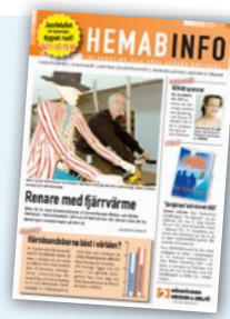
Nr 3 2007