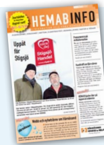
Nr 1 2009