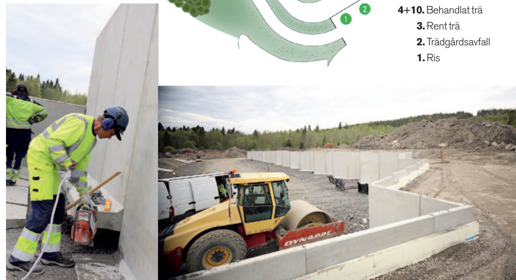
Bygget av Härnösands Kretsloppspark pågår för fullt.