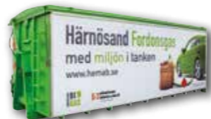
Gasflaken sänder ett tydligt budskap om sitt innehåll. Här har vi miljön i tanken!

Biogasen behandlas ytterligare, för att omvandlas till fordonsgas som kan användas som bränsle. Koldioxiden i biogasen avlägsnas från metanet genom filtrering med speciella membran. Även den tekniken är enkel och energieffektiv. Fordonsgasen komprimeras sedan och lagras på gasflak som fraktas till HEMABs tankstation vid E4an i Härnösand.