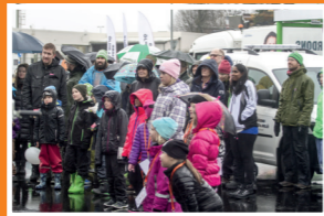
Besökarna verkade glömma regnet för ett ögonblick när de trollbands av Love Melanders illusioner....