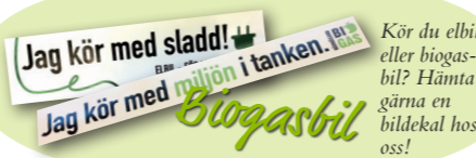
Kör du elbil eller biogasbil? Hämta gärna en bildekål hos oss!