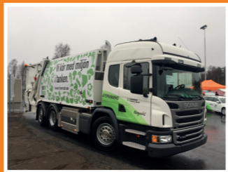
Vi passade såklart på att visa upp vår nya, 100% gasdrivna sopbil.