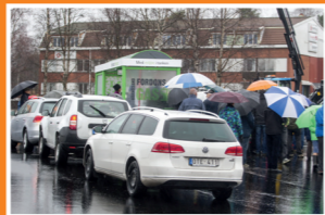
Många hade väntat länge på att kunna tanka gas på hemmaplan.