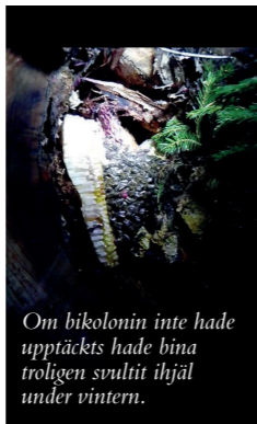
Om bikolonin inte hade upptäckts hade bina troligen svultit ihjäl under vintern.

– Tydligt är det bi-brist, så då känns det ju som att vi har gjort en god gärning, avslutar Johansson.