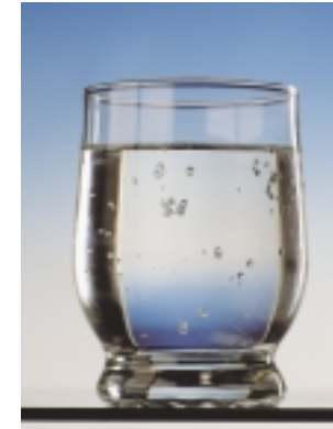
Ett glas vatten från Hemab klarar krav på lägre fluoridhalt.

■ Den av livsmedelsverket beslutade nya dricksvattenkungörelsen som träder i kraft 25/12 i år skärper kraven på gränsvärden i dricksvatten. Tack vare god framförhållning och utförda justeringar klarar HEMAB dessa skärpta krav bra i sina vattenverk. Det är framför allt gränsvärden för fluorid som vissa vattenproducenter får problem att klara, men i Härnösand är detta alltså OK.