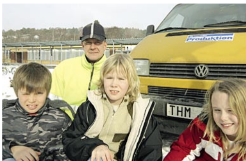
Vägverket Produktion är en konkurrensutsatt del av Vägverket. Fr o m 1 juni tar man över gatuskötseln med mera i Härnösand.

Telefonnumret för felanmälan, 0611-156 87, blir samma och en del personal flyttar också över från NCC till Vägverket Produktion.