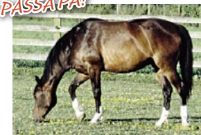
Ridklubben sponsras av HEMAB.