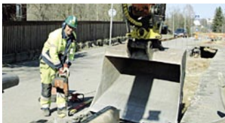
Sommaren 2006 kommer fjärrvärmerna till Gänsviksdalen, 2007 till Eriksdal.

Det stora intresset för fjärrvärme håller i sig, inte minst sedan ett konverteringsstöd infördes för dem som vill byta till fjärrvärme från olja eller direktel. Stödet täcker 30 procent av kostnaderna upp till 30 000 kronor.