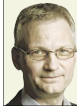
Har du tänkt på att varje dag just nu blir ljusare än gårdagen!

I det här numret av HEMAB INFO ger vi extra utrymme åt vår viktigaste målsättning, "länets lägsta priser". I några verksamheter är vi redan där, i andra är vi en bit på väg. Det målet känns rätt för oss på HEMAB och jag är övertygad om att du som kund också uppskattar det.