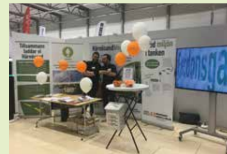
Hållbarhet var temat för HEMABs monter på Fokusmässan 2017

På ett kilo fordonsgas går det ungefär 1,5 liter bensin, eller 1,3 liter diesel. Att fordonsgasen räknas i kilo istället för liter gör att priset på fordonsgas kan verka högt. Så är dock inte fallet. Idag kostar 1 kilo fordonsgas 16,50 kr vid vår tankstation för fordonsgas. Omräknat motsvarar det en kostnad på 11 kr per liter bensin. Bra pris, tycker vi!