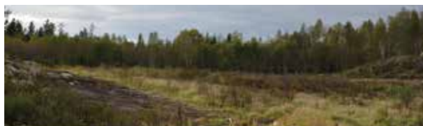
Här ska anläggningen för biogasproduktion byggas

En fredag i september minglade studenter från Teknikcollege och Heta Utbildningar med representanter från Härnösandsföretag i Logosols lokaler. Teknikcollege, Edmo Lift, Technichus, Heta Utbildningar, Logosol och HEMAB arrangerar studentmingel årligen. Det första stod HEMAB värd för 2012 på Energiparken. Vi är övertygade om att möten mellan studenter och lokala företag skapar framgångsrika relationer och nätverk. Det vill vi gärna bidra till.