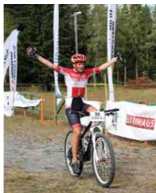
HEMAB var huvudsponsor för tävlingarna